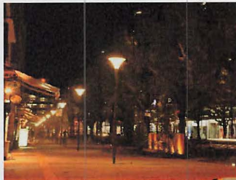
照明灯・フットライトの設置