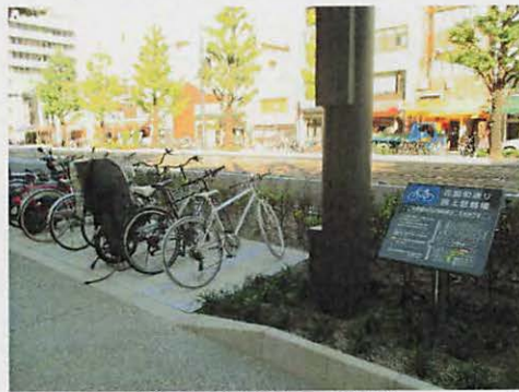
路上駐輪場の設置