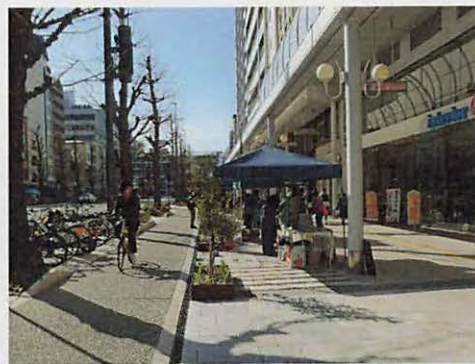
自転車と歩行者の分離 (歩行者空間の安全確保)